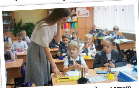
Волнение и радость сопровождали в этот день учителей-дублеров и их наставников.

После уроков подводится итог работы учителей-дублеров. На обсуждение выносятся множество вопросов, и высказываются все пожелания. Но все единогласно приходят к решению, что все удалось!!! Ребята в восторге от прошедшего дня, но на лицах читается усталость, ведь труд учителя — это тяжелая и ответственная работа, не каждому она по плечу.