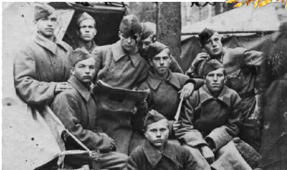
Участники боев под Сталинградом (фамилии не установлены)