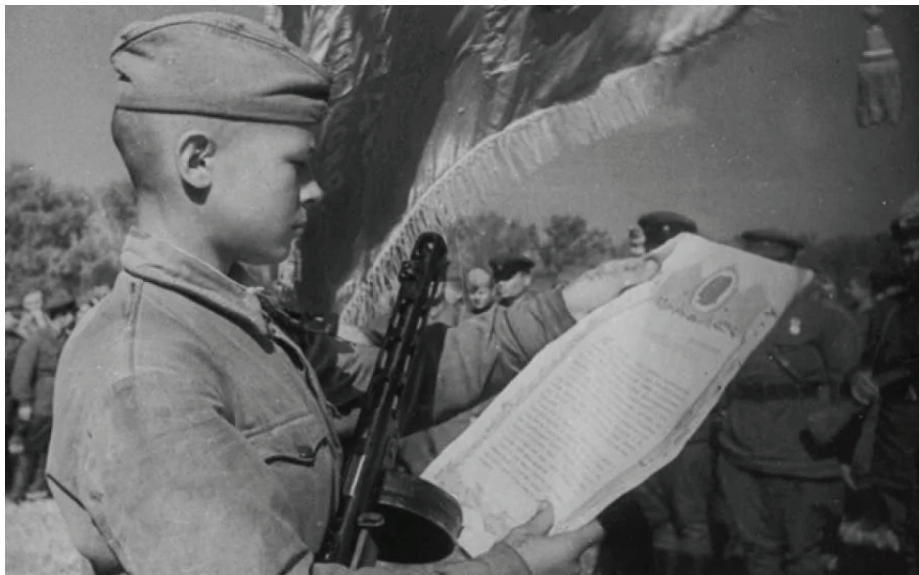
Участник боев под Сталинградом (фамилия не установлена)

Помню, он мечтал: «Разобьем фашистов, кончится война, приглашаю всех вас в Сестрорецк. Знаете, где этот город? Под Ленинградом. Финский залив, пляж, дюны, протекает река Сестра, дома отдыха, город-курорт... А там мой дедушка, славный дедушка торгует мороженым и как моих друзей, однополчан он вас всех угостит вдоволь, сколько кто хочет, мороженым. Как будет хорошо, не будет войны и все будем вместе...» Все задумались о своих домах, о мирной, счастливой, солнечной жизни — какая взрослая, зрелая вера в этом мальчишке в Победу, в мирную, богатую, счастливую жизнь — «вдоволь, сколько кто хочет». И много было еще детства у него: мечта о детском лакомстве — мороженом.