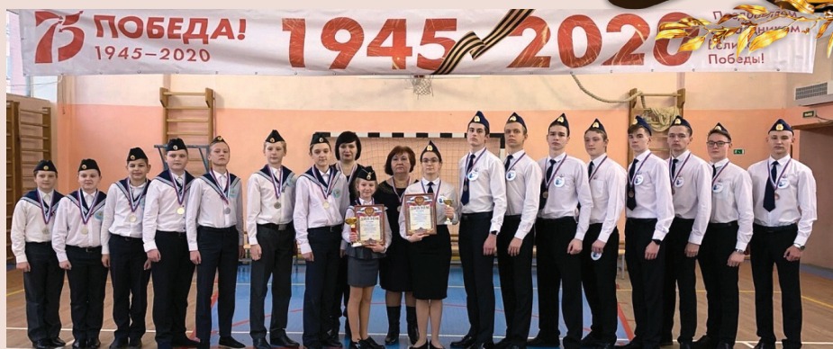
Команда 5-А и 10-А классов на Районном конкурсе смотра строя и песни среди обучающихся общеобразовательных учреждений Пушкинского района Санкт-Петербурга