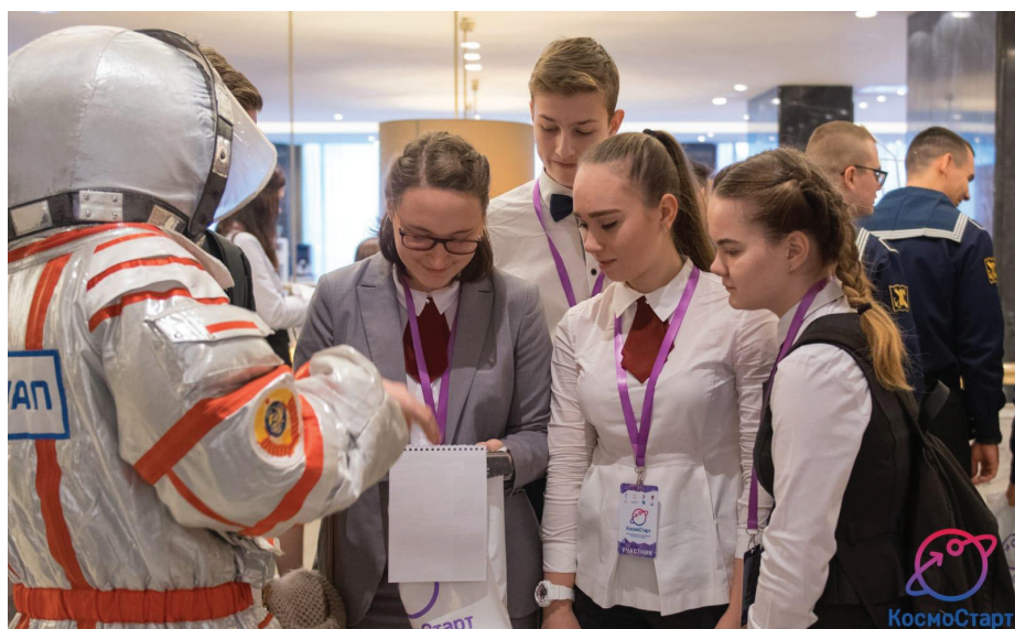
Космонавт в скафандре встречает участников форума КосмоСтарт в ГУАП

Для всех тех, кто мечтает в будущем о покорении космического пространства, участие в Форуме и Фестивале может стать отличной стартовой ступенькой. Призываем не упускать эти возможности и смело идти к своей мечте!