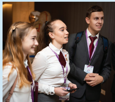
На открытии фрума Космостарт в ГУАП