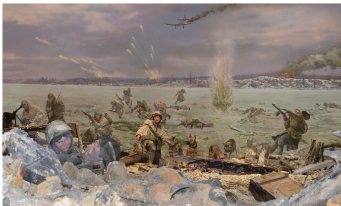
Девушка с собаками в центре фото — 19-летняя Рита Меньцагина. Она входила в девичью команду, которая в Сосновке дрессировала собак.