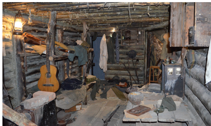
Немецкий офицерский блиндаж. На нарах висит автомат, на столе — гранаты, пистолет, фотографии.